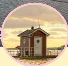
Hotell Utter Inn