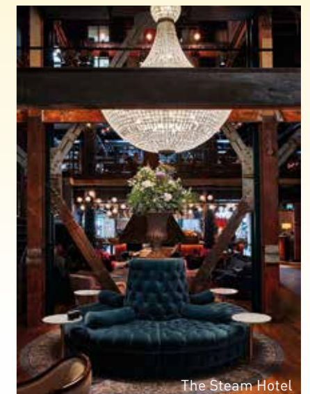
The Steam Hotel

En destination för människor som vill uppleva och bli berörda. En plats för dig som inte nöjer dig med bra. Gemensamt för alla som kommer hit är att de vill tillbaka snart igen.